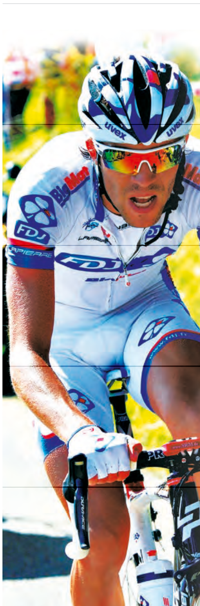
Thibaut Pinot, zespół FDJ-Big Mat 2012