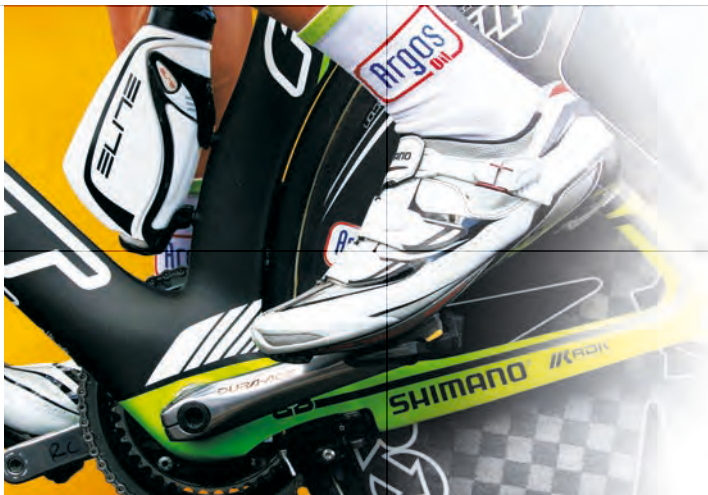
Zespół Argos-Shimano 2012